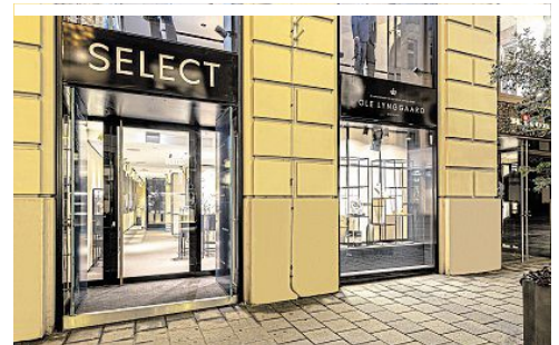
Große Schaufenster zum Gustieren: Das Geschäftsportal in der Seitnergasse im Goldenen Quartier