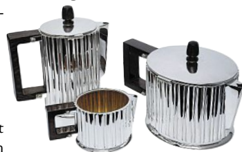
Kaffeegeschirr von der Silbermanufaktur Jarosinski & Vaugoin